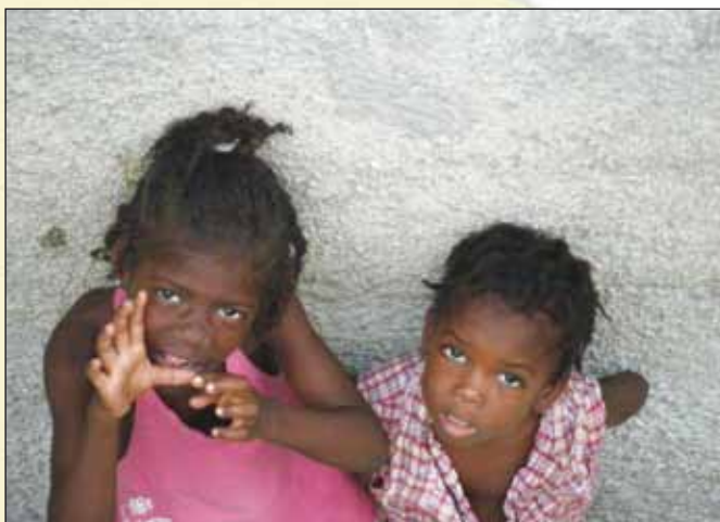
"Is onze toekomst veilig...?"

De echte ouders doen dit om bestwil. De mensen die een restavek in hun huis nemen, beloven de biologische ouders ervoor te zorgen dat het kind naar school kan en dat het eten en onderdak heeft. Positief dus! Maar het is niet uit edelmoedigheid, hoor! Zij hebben er zelf (natuurlijk?) baat bij. In ruil