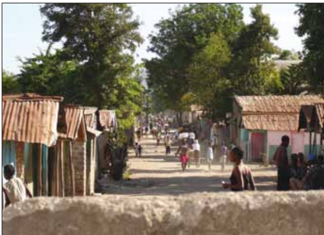
Kan men hier gezond en gelukkig opgroeien?