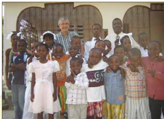
Een blij communiefeest in het weeshuis

Wat moeten ze zoal doen? Werken op het veld, water halen, poetsen, de was doen, koken, boodschappen doen, op de kinderen of de huisdieren letten. Sommige restaveks hebben het goed. Het is wel nooit aangenaam buiten je eigen gezin te zijn, maar zij worden gerespecteerd. Helaas hebben de meeste restaveks een zwaar leven. Zij worden vaak niet als een mens bekeken, maar als een 'ding'. Voor sommigen is het onmogelijk hun gevoelens te uiten. Zij mogen alleen spreken als hun iets gevraagd wordt. Zij spreken alle leden van het gezin aan met 'monsieur' en 'madame'. Zij mogen niet aan tafel zitten bij het gezin en krijgen de restjes. Het komt voor dat sommigen op de grond, onder de tafel of op een ongunstige plaats moeten slapen. Hoe gaan zij om met de kinderen? Velen worden mishandeld of misbruikt.