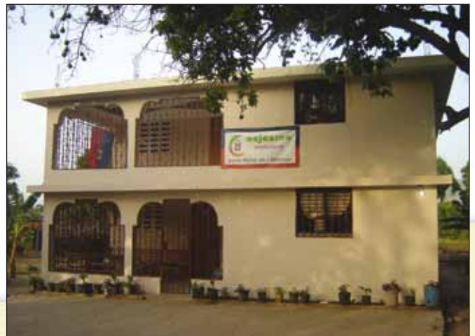
Het weeshuis biedt liefde, veiligheid en geborgenheid.